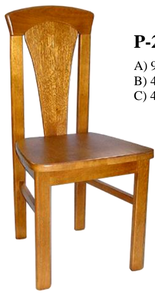
P-2 A) 94 B) 47 C) 45