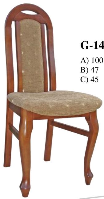
G-14 A) 100 B) 47 C) 45