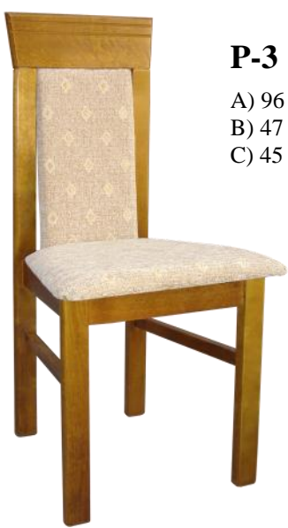
P-3 A) 96 B) 47 C) 45