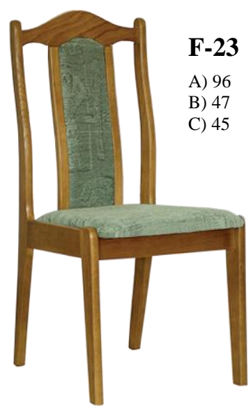
F-23 A) 96 B) 47 C) 45