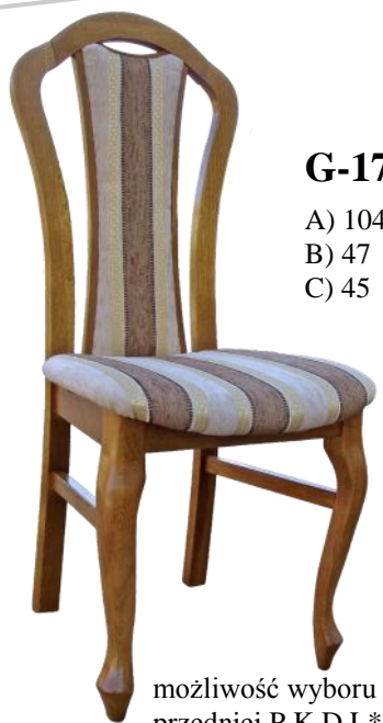
G-17 A) 104 B) 47 C) 45

możliwość wyboru nogi przedniej P,K,D,L*