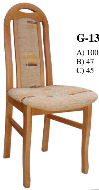
G-13 A) 100 B) 47 C) 45