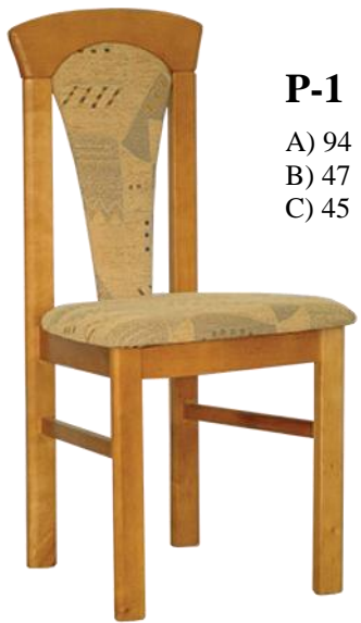
P-1 A) 94 B) 47 C) 45