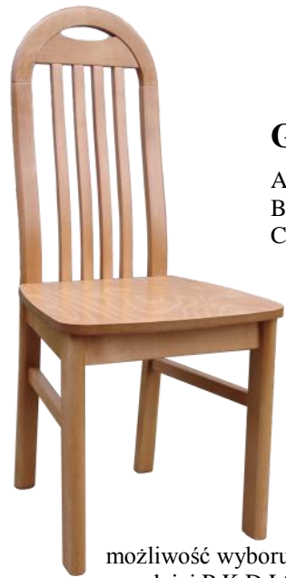
G-15 A) 100 B) 46 C) 45

możliwość wyboru nogi przedniej P,K,D,L*